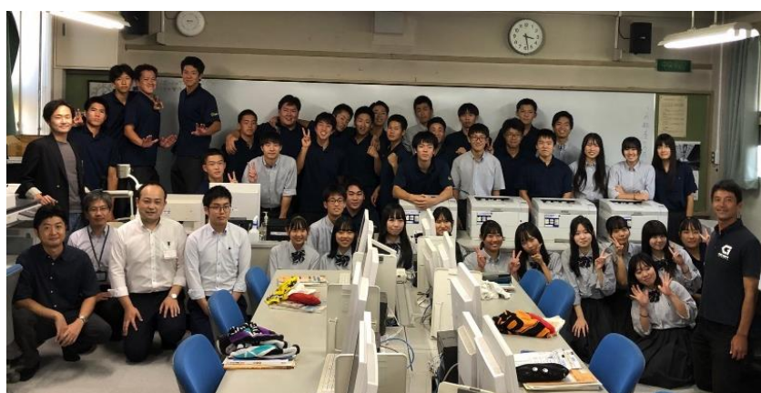
各グループのビジネスプラン発表を終えて