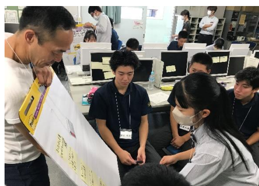
メンター（NOBUNAGA キャピタルビレッジ 峠様）との原案づくりの様子