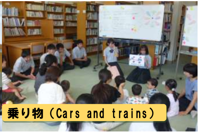
乗り物 (Cars and trains)