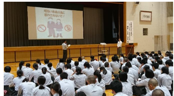
生徒代表 お礼の言葉