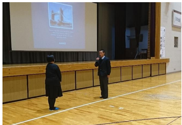
生徒代表お礼の挨拶