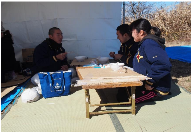
豚汁・おにぎりおいしくいただきました！