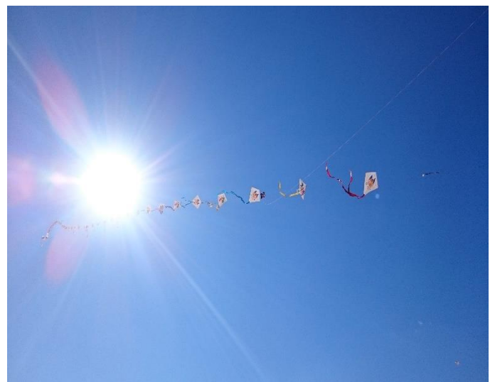
快晴の中舞い上がる連凧