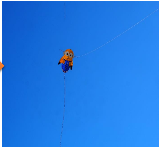
舞い上がった市岐商虹凧