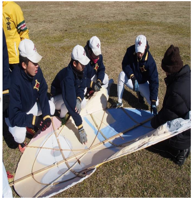
大虹凧を組み立てます