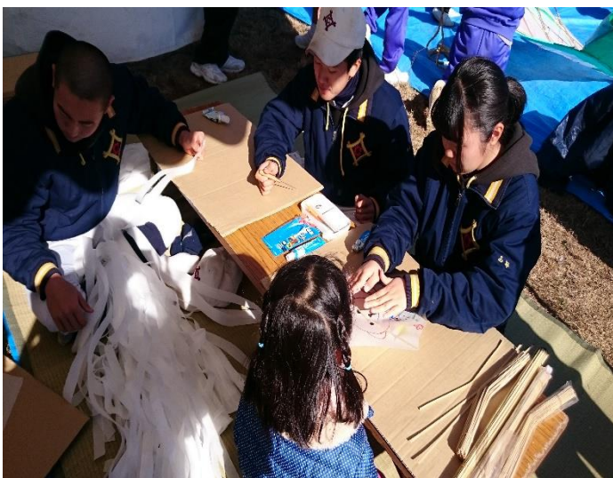
凧作り教室で子どもに凧作りを教えます

自治会の方々は、『こんなに高々と舞ったのは13年ぶりです。』と言われ、満足のいくものになりました。