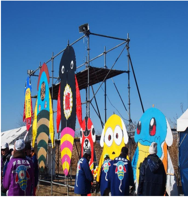
大会の名物大虹凧