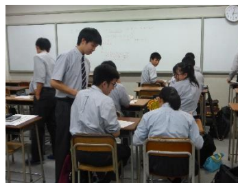
財務課の活動の様子