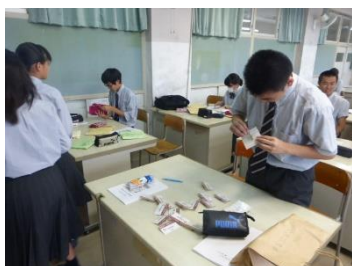
総務課の活動の様子