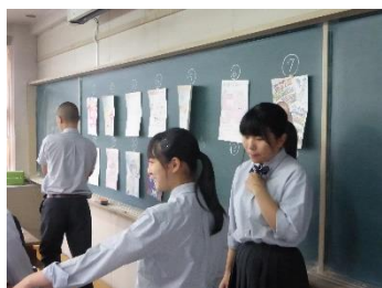
販売促進課の活動の様子