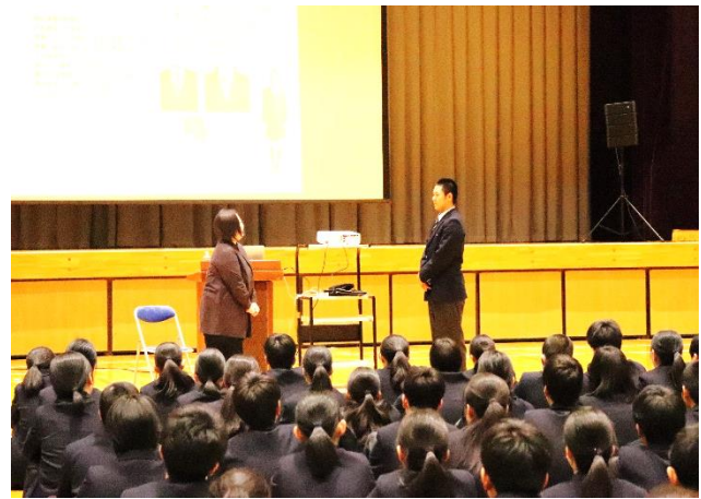
お礼のあいさつの様子