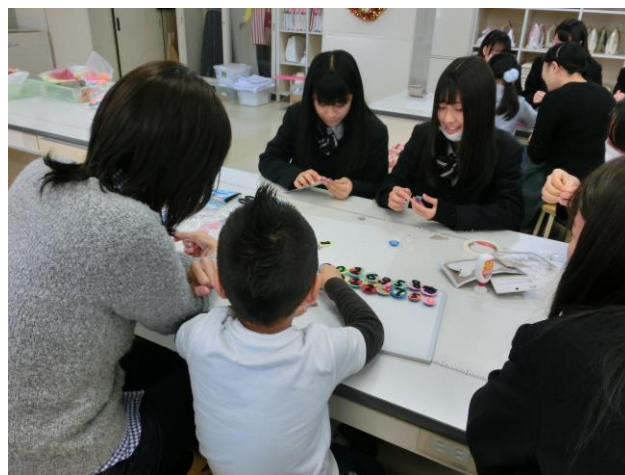
「月」と「日付」の数字を貼ります