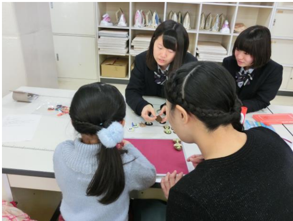
ホワイトボードに布を貼ります

「毎日が楽しくなるカレンダーが完成できたと思います。」「カレンダーは子どもの手の届くところに置いて、交換をやらしてもらおうと思います。」「フェルトの材料がとてかわいくてびっくりしました。」などのご感想をいただきました。