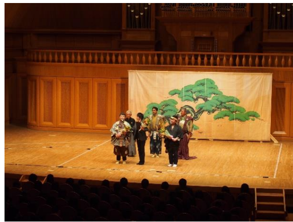
公演ありがとうございました!