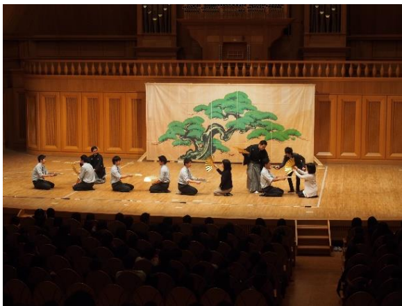
先生と生徒も参加しました!