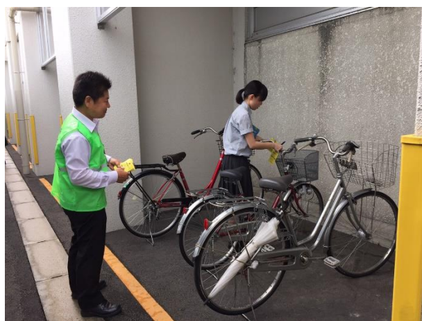
【警察署の方と一緒に自転車点検をしました】