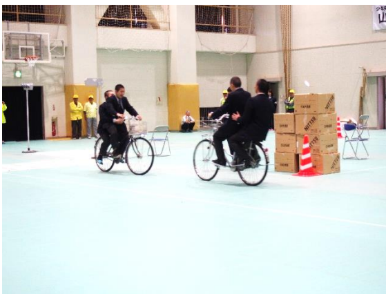
生徒による危険走行の実演（二人乗り）