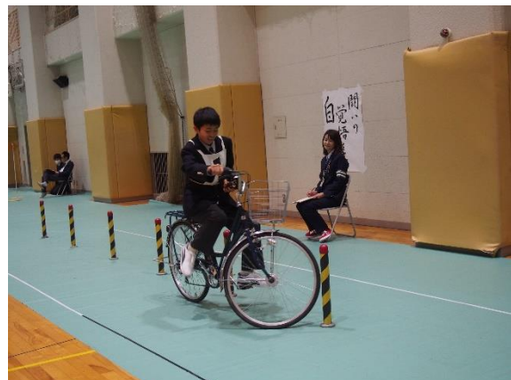
生徒による実技試験