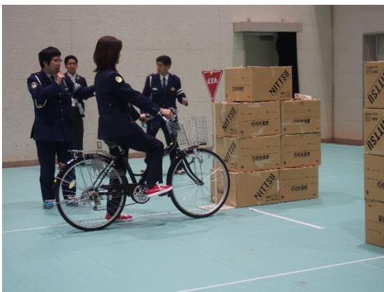
岐阜市役所の方による模範走行