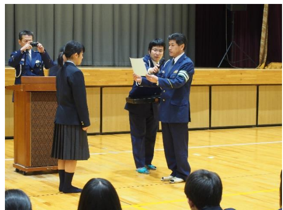
最優秀クラス表彰 1年B組