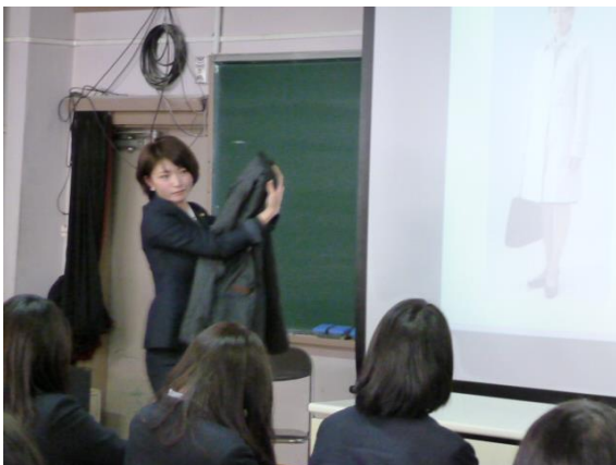
脱いだジャケットの持ち方について

「スーツは、着たときのサイズ感が制服とは違い少しぴったりしたくらいで丁度いいことなど、知らないことをプロの方から教えてもらってとてもためになった。」という感想を書いた生徒もいました。