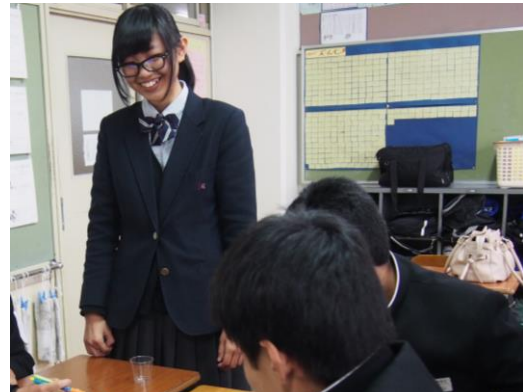
グループに分かれ、新商品を考えました