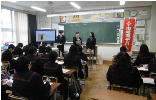
礼の仕方について説明しました