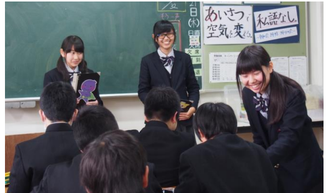
中学生に質問、岐阜特産品を知っていますか？