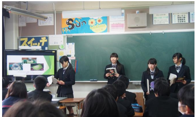
岐阜特産品を使った商品開発について説明しました