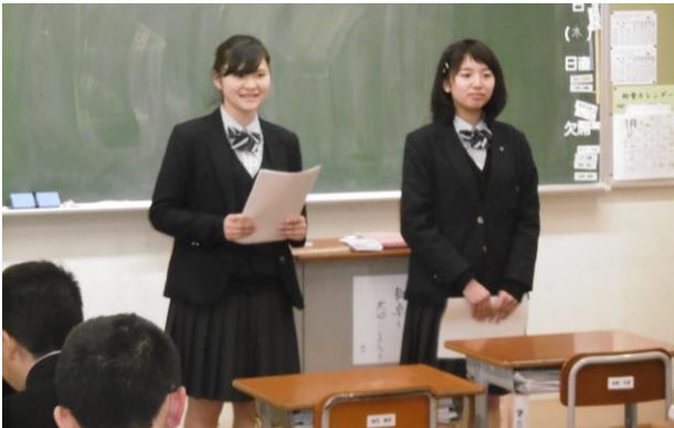
市岐商デパートについて説明しました

出前授業に参加した生徒から「限られた時間の中で、中学生の発想やアイデアを知り、私たちも勉強になりました。」と言った感想が出されました。