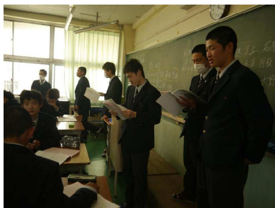
手引書で仕事の確認をしています