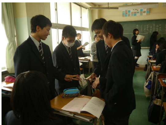
販売課は人気があります

第32回市岐商デパートの取り組みがスタートしました。1クラスを2店舗に分け、7課（販売課・仕入課・総務課・財務課・販売促進課・管理課・特別事業課）の中から担当したい係を決定しました。8名の取締役は、2人1組で1年生のクラスに出向き、係決定がスムーズに進むようサポートをしました。1年生のクラスでは、最初は不安な姿が見られましたが、売場主任決定後は、積極的に立候補するなど会議が進むにつれ活発な姿勢が見られました。2・3年生のクラスでは、昨年や一昨年の経験を活かして、手際よく係が決められていました。本日決定した係の仕事に誇りを持ち、11月3日の第32回市岐商デパートにお越しいただくお客様の笑顔が見られるよう一生懸命取り組んでいきます。