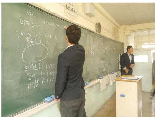
係が決められていきます