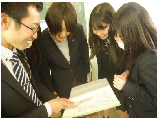
指導教諭と係を確認