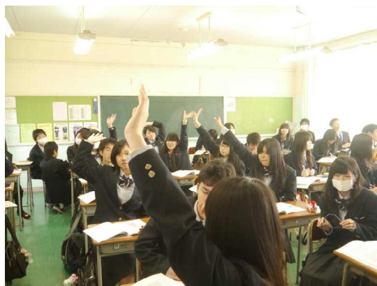
積極的に参加しています