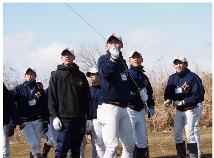
風に負けないよう、しっかりと紐を握り操りました