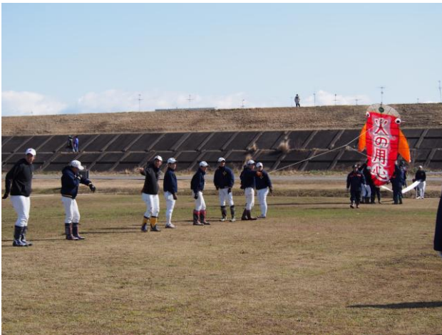
4mの大虵凧「火の用心」鏡島消防団作