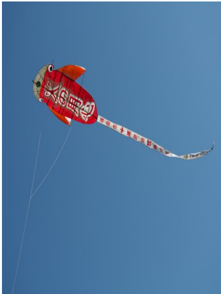
空から「火の用心」を呼びかけました