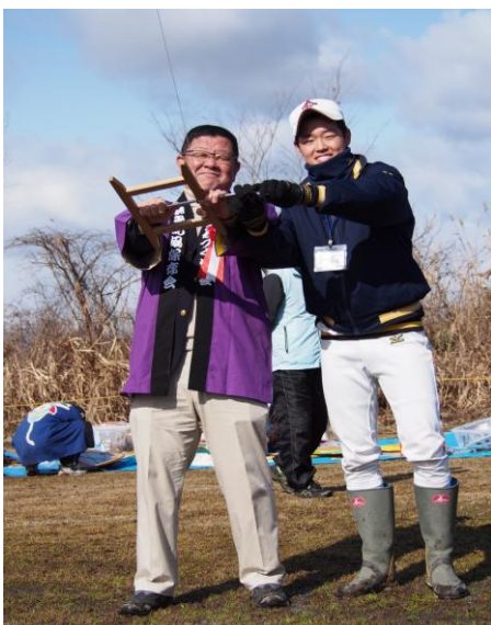
「市岐商の発展を願って」と学校長