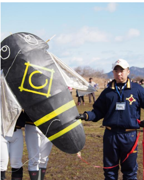
市岐商凧、力強く揚がるよう願いを込めて