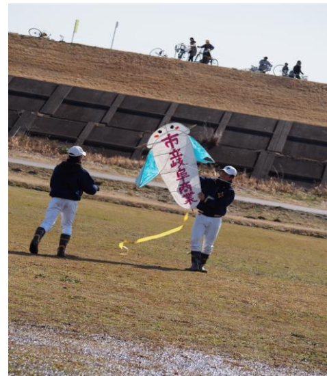
市岐商風 NO.2 も青空へ