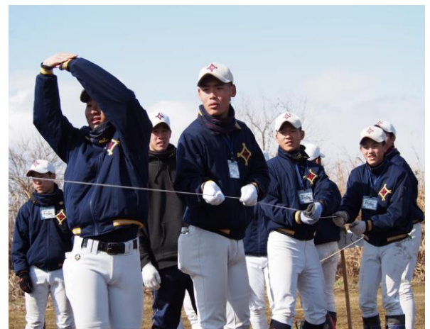
準備 OK! さあ、気合いを入れて・・・