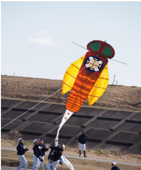
強い風が吹いた瞬間を逃さずに、とべ！！