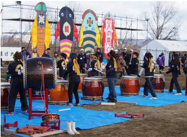
鏡島太鼓クラブの方々による太鼓演奏