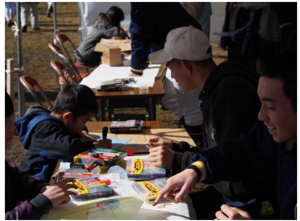
凧に絵を描く子どもたちのサポート