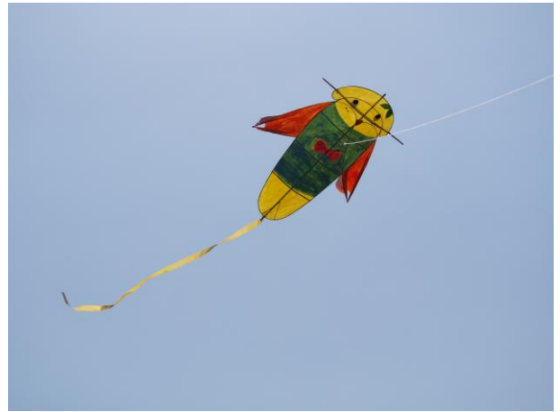
気持ちがいいナッシー