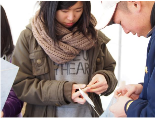
生徒会は子どもたちの凧作りのお手伝い