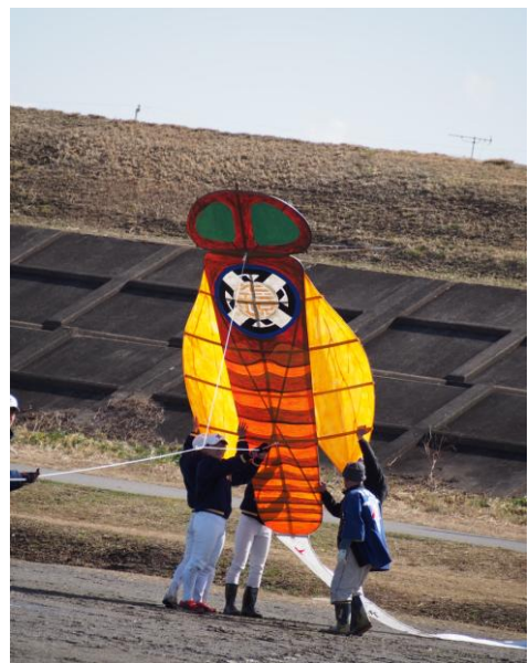
4 mの大きさに少し戸惑い気味