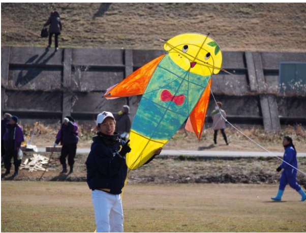
次はふなっしーの番だナッシー