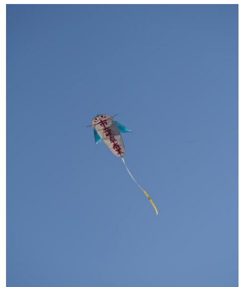
しっかりと力強く泳ぎました